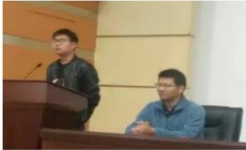
(开班仪式上, 邢班长代表学员发言)