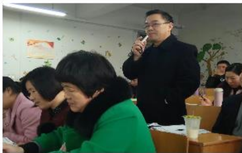
(儒雅的吴老师积极与专家互动)