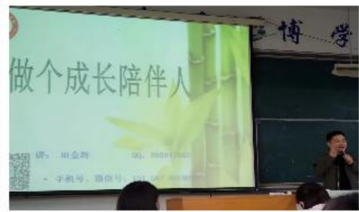
(多才多艺的田老师与大家分享经验)