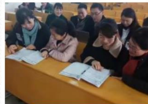
(课后, 老师们及时交流, 随时记录)